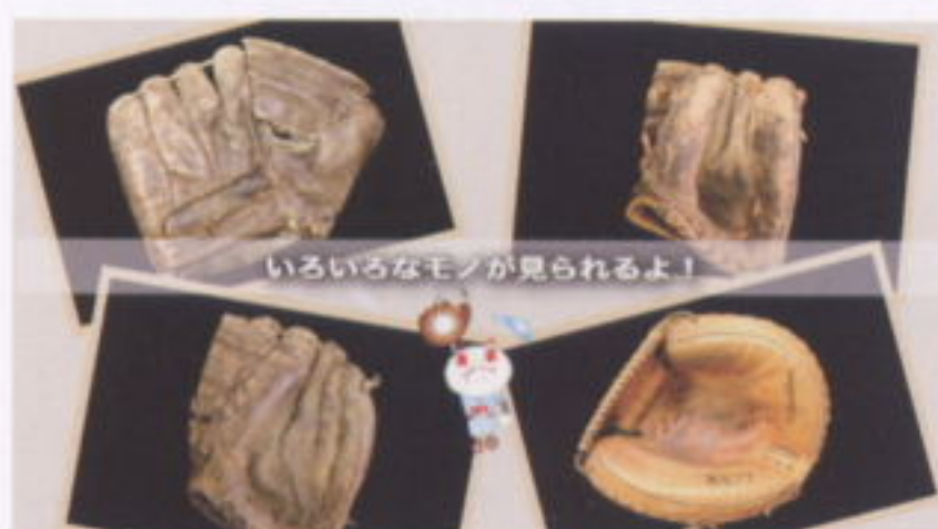
①スクリーンセーバー