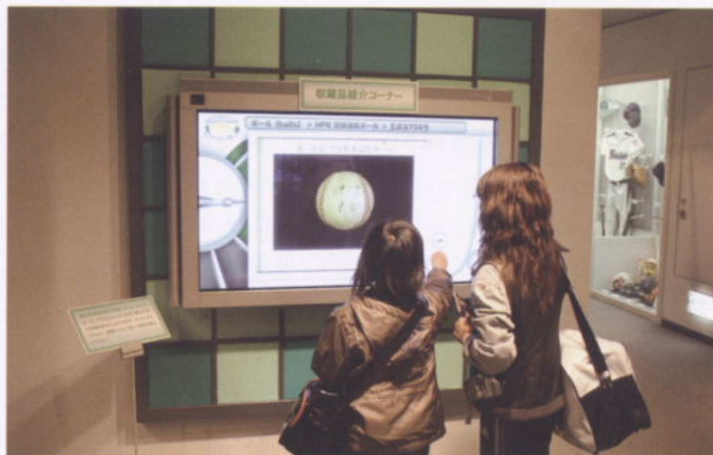
見たい用具が見られます